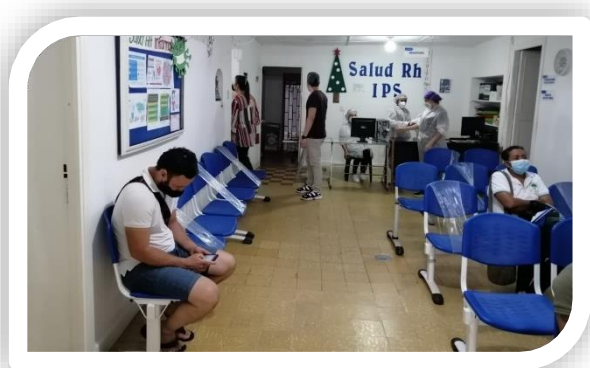
Distanciamiento Social en áreas comunes